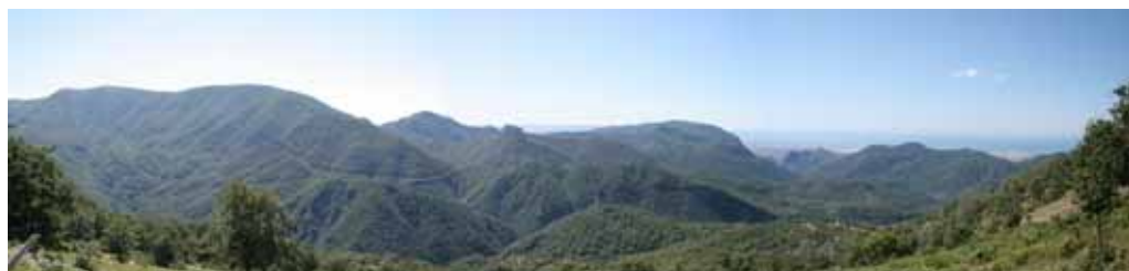
Acerno. Veduta dalla Toppa del Magnone