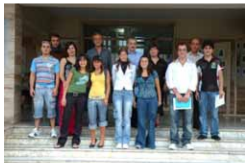
Aula Consiliare

- "Verdi Emozioni" con i concorsi di poesia e fotografia dedicati ai ragazzi ed ai giovani delle scuole medie ed elementari che ha visto la partecipazione di tantissimi ragazzi le cui poesie sono state raccolte in una pubblicazione ad hoc stampata a cura della Associazione;