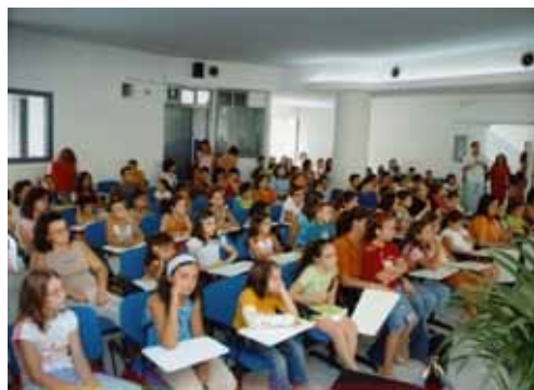
Aula Consiliare

In questa sezione Acerno Arte tende ad avvicinare alla bellezza dell'arte portando tale sollecitazione nel mondo scolastico, luogo deputato alla formazione della cultura dell'arte.