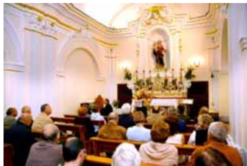
Chiesa dei Morti Concerto di M. A. Landskowska(violino) e C. Moscardiello (pianoforte)

Grande successo di pubblico e di critica a tutti e