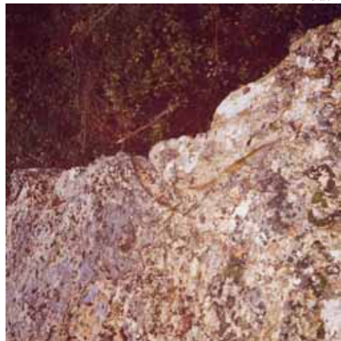
Impronta della zanna dell'Elefats Italicus custodito nella Biblioteca Comunale.