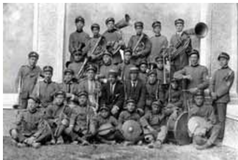
La Banda Civica Comunale - 1922

La banda musicale è una istituzione iniziata con il M° Juppa Vitale intorno al 1850. Nel corso di un secolo e mezzo ha vissuto momenti di successo e momenti di pausa dovute alle guerre e/o alla mancanza di fondi, di uomini e poi in tempi più recenti al terremoto.