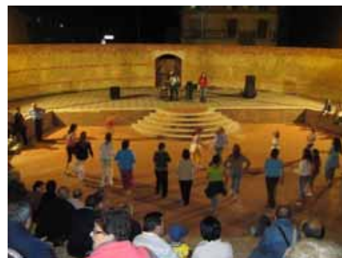
Anfiteatro Comunale

Scopo della manifestazione è creare occasione