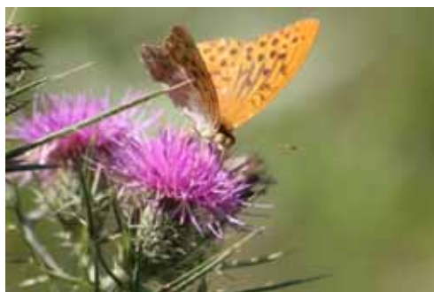
Acerno. La natura