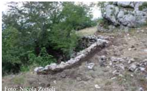
Acerno: Panorama da Tempa Castello