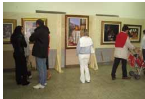
Scuole Elementari

due gli spettacoli tenuti egregiamente dalle Compagnie teatrali Instabile di Bellizzi e Avalon Teatro di Battipaglia che hanno messo in scena due esilaranti e gradevoli commedie cui sono stati riconosciuti premi e segnalazioni in vari concorsi nazionali come la Bombetta