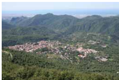
Acerno. Panorama da Toppa del Magnone