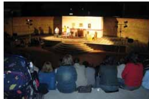
Anfiteatro Comunale

(Argento Vivo) e Classica (Concerto per pianoforte e violino con C.Moscariello e M.A.Landskowska) ha riscosso pubblico e allietato piacevolmente le serate acernesì.